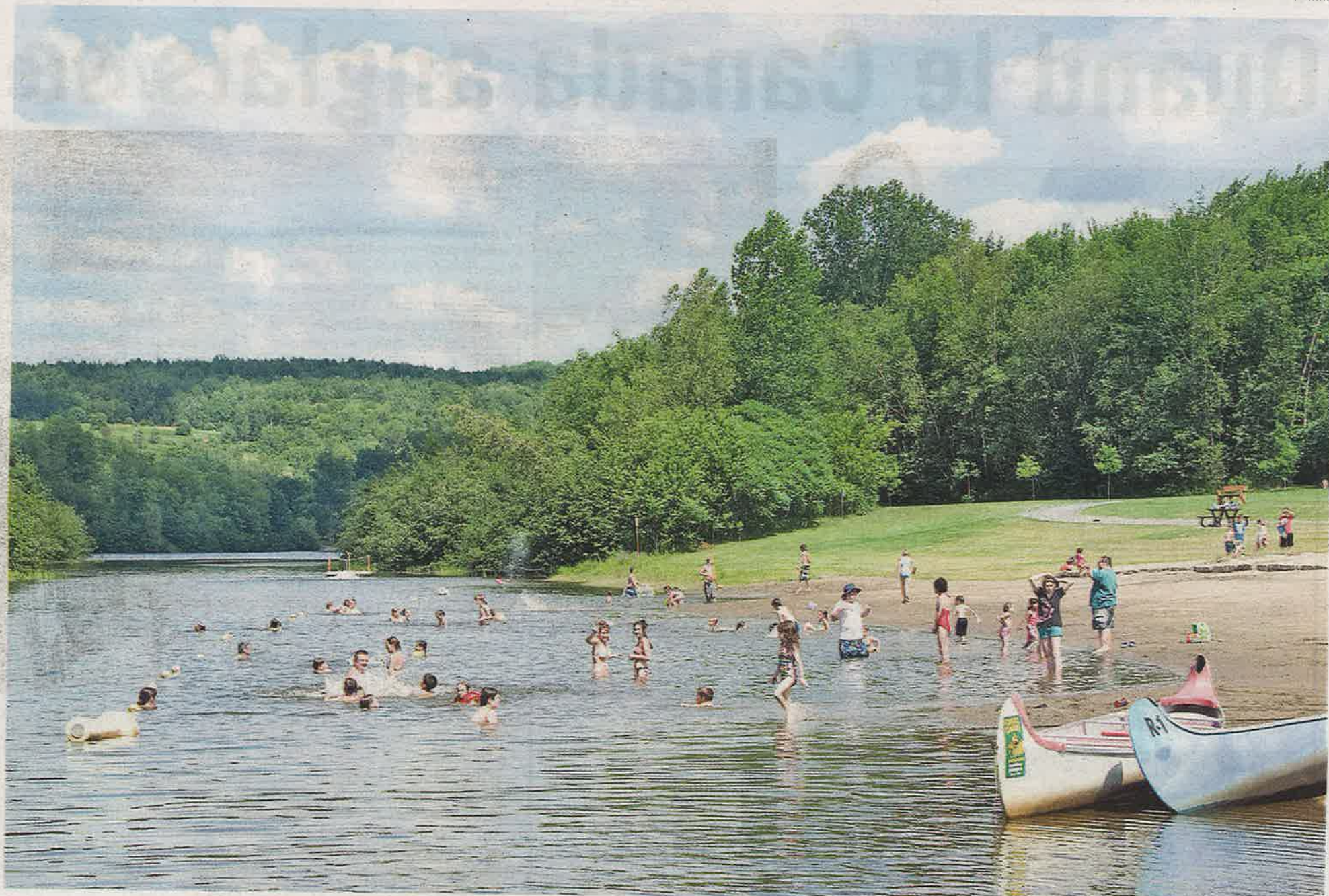
Méconnu et sous-utilisé, le Centre de la nature de Cowansville se prête à maintes activités de plein air, comme la baignade, le kayak, le canot, le pédalo, le volley-ball, la balle molle et le tennis, et ce, gratuitement.